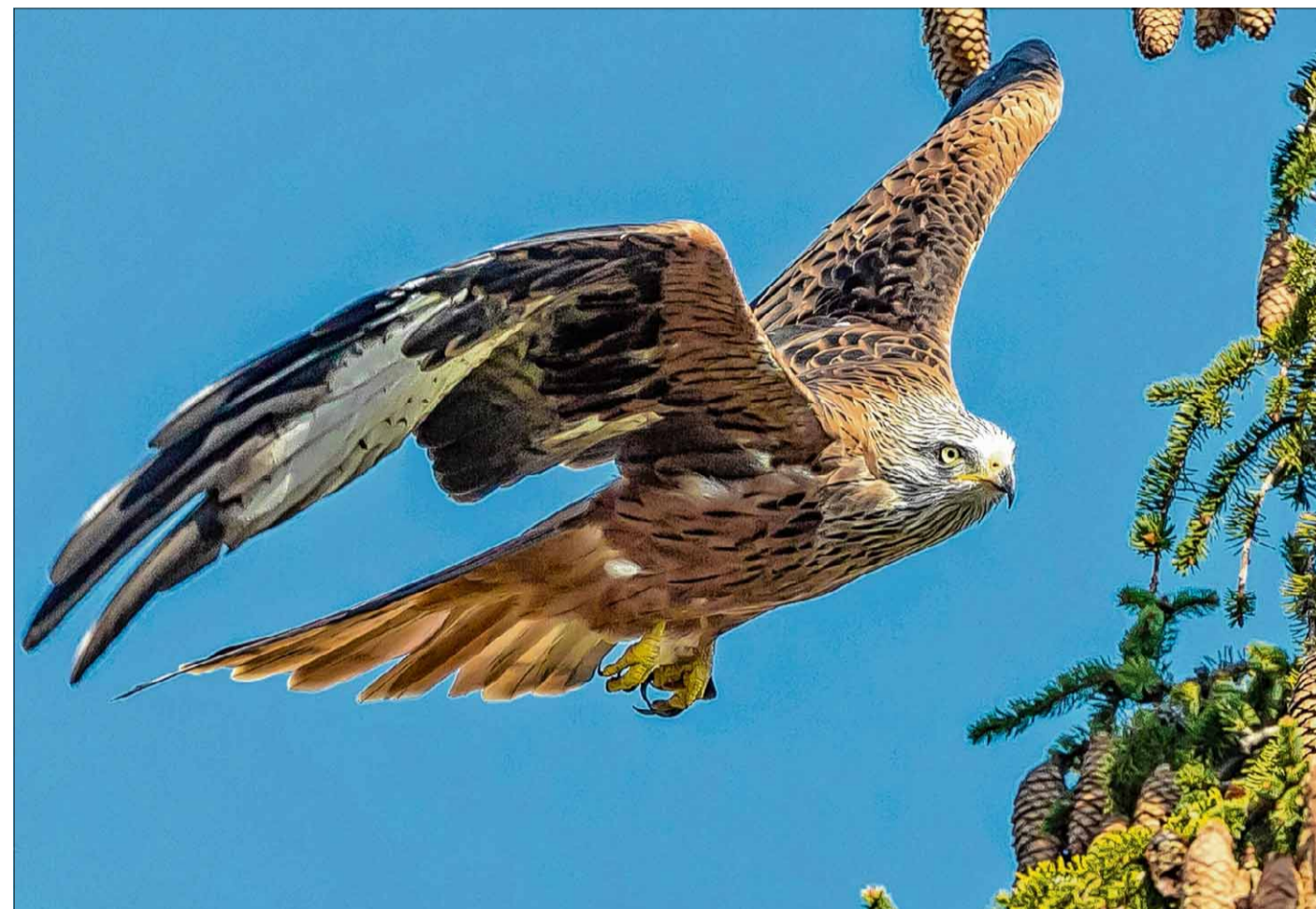
Ein Rotmilan im Anflug auf eine Fichte.

Die Winterzählung der Rotmilan-Schlafplätze fand in ganz Europa vom 8. bis 10. Januar